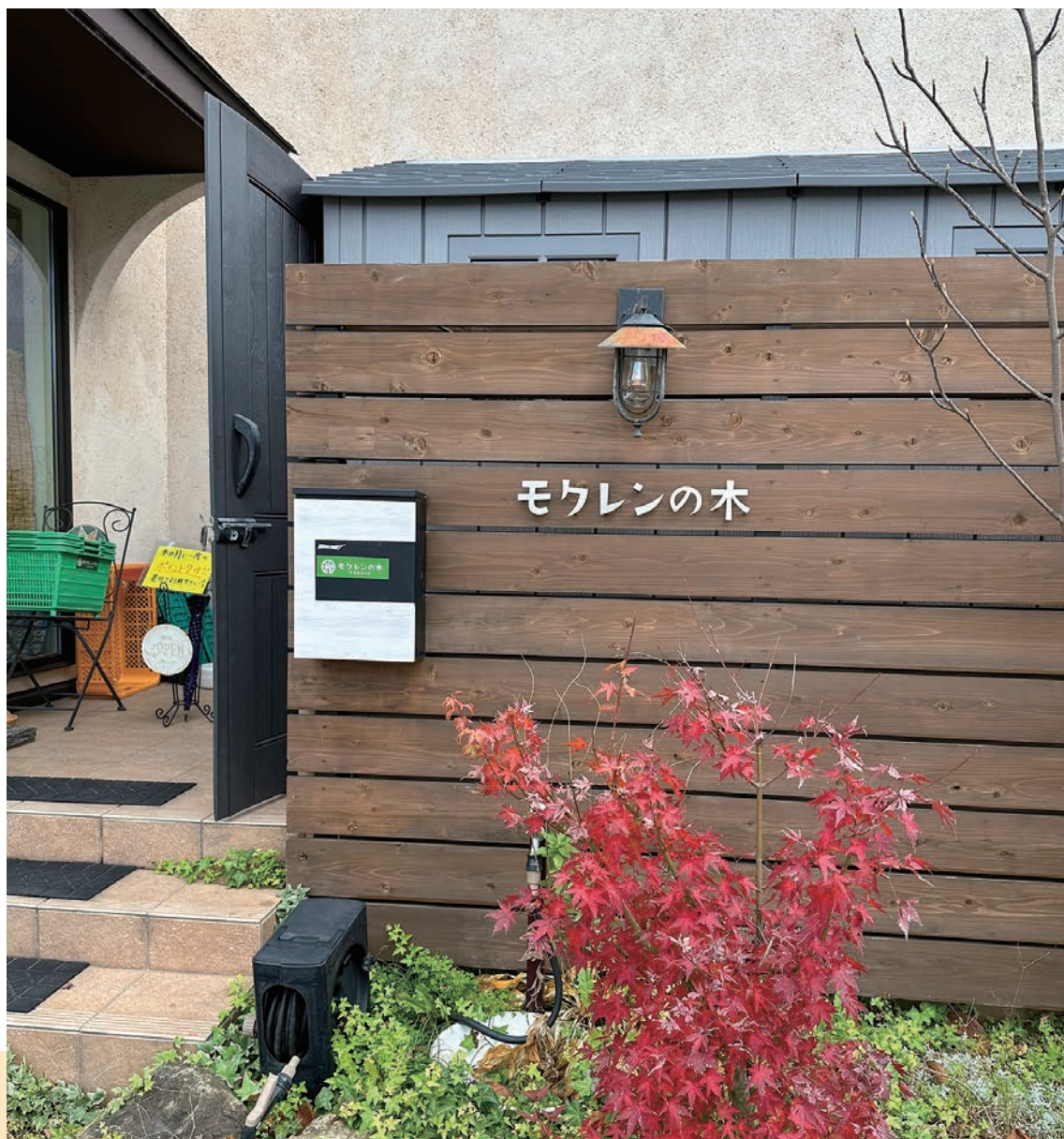
自然食品の店 モクレンの木