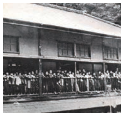
▲東山疎開してきた子供たち②