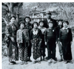
▲東山疎開してきた子供たち①

今年、東山盆踊りは80周年となります。コロナ禍のときは開催されませんでした。今年8月1日、2日、3日、4日に開催となりました。会津人の優しさで温かさあふれる東山盆踊り。いつまでも大切にしたいものです。