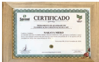
▲コーヒーマイスターブラジル