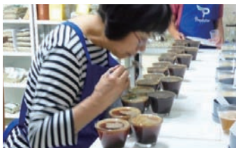
▲カップングの様子