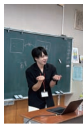
▲白方小学校で特別授業