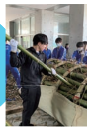
▲須賀川二中で松明作成