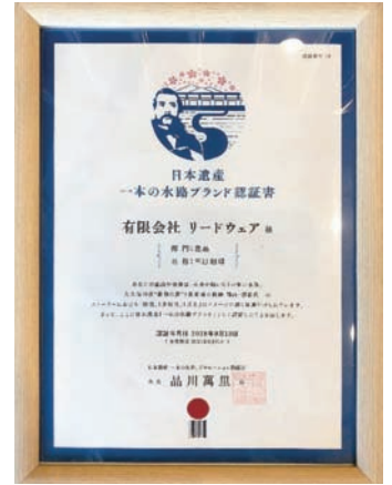
▲日本遺産「一本の水路ブランド」