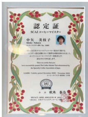
▲コーヒーマイスター日本

ブラジルの肉の煮込み料理もおいしく、食べられなかったお肉が食べられる様になりました。ポンデケーキもとてもおいしくそれを食べにまたブラジルへ行きたいくらいです。