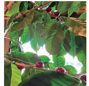
▲コーヒーの木の実