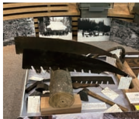
▲マドノコ 材木の伐採に使われました