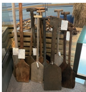
▲コウシキ 雪下ろしの道具(ブナ材)

中2階には人々の暮らしを紹介する様々な民具を展示。ブナ林などの自然と共に暮らしてきた様子を見ることができ、雪国ならではの先人の知恵と伝統文化を紹介しています。