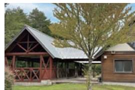
▲AUTO CAMP FIELD

震災後、一時、避難地域となり閑散としていたパークも、いまでは再び人々が笑顔で集まる場所になりました。