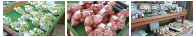
店内所せましと並べられた旬の果物、野菜、お弁当、加工品の数々

宮城県との県境にほど近い伊達市梁川町の東大枝地区を通る県道321号線。かつてコスモス街道と呼ばれたほど道路際には色とりどりのコスモスの花が咲き誇っていたようです。国見町から国道349号線へつづく五十沢国見線との交差点手前に「まちの駅 来て笑顔!食べて元気!になれる駅 おおえだコスモス直売所」があります。この地域は昔から果物栽培に適した土壌に恵まれ軽トラでの販売が評判を呼び、昭和60年代頃から直売所を開店。平成17年には増床し品数もさらに豊富になると、県内外から訪れる客も増え平日でも客足が途切れないほど。季節は夏本番の桃から話題のシャインマスカットなどの葡萄、そして林檎へとまさに果物が実りゆく秋を迎えます。