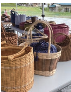
▲お城山ルシェの様子

にほんまつ城報館では観光誘客や地域活性化のため、月に1回程度マルシェを開催しています。二本松市の特産品、土産物品、工芸品等のほか、ハンドメイド作品なども展示販売されています。出店を希望される方は事前のお申込みが必要です。