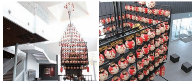
▲二本松の提灯祭りの太鼓台がお出迎え

開催期間：2022年10月8日(土)～11月13日(日) 9時～16時まで(期間無休)