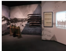
▲二本松少年隊影絵を使った演出