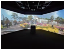
▲四季の景観を楽しめる臨場感あふれるガイダンス室

施設1階は二本松の歴史を学べる歴史館になっています。ガイダンス室の大型スクリーンでは現代の情景に藩政時代の城門などの再現映像を重ねて、往時を身近に体感することができます。常設展示室では中世から一貫して同じ場所に存在し続けた二本松城を軸に、地形や時代背景、人や文化、都市計画に至るまでをグラフィックや映像、実物資料を用いて解説していて、丹羽氏の町づくりや二本松少年隊の歴史などを学ぶことができます。