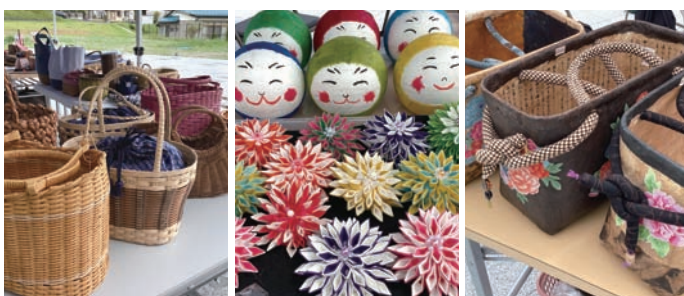
▲お城山ルシェの様子

にほんまつ城報館では観光誘客や地域活性化のため、月に1回程度マルシェを開催しています。二本松市の特産品、土産物品、工芸品等のほか、ハンドメイド作品なども展示販売されています。出店を希望される方は事前のお申込みが必要です。