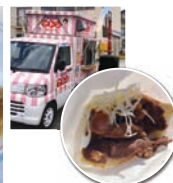
▲マトンケbabカー(只見町) マトンケbab