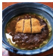
▲おふくろ(金山町) カツカレー・ミックスラーメン

会津川口駅…本名駅…会津越川駅…会津横田駅…会津大塩駅…会津塩沢駅…会津蒲生駅…只見駅