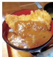
▲太郎館(只見町) カツカレー