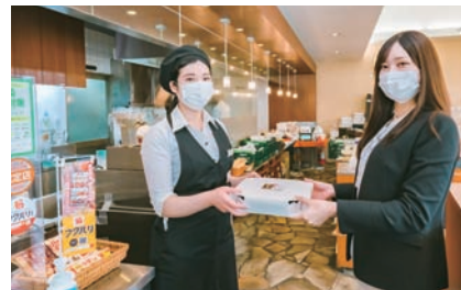
▲テイクアウト

フクバリはスマートフォンで簡単にテイクアウトの注文がおこなえるサービスです。「フクバリ」という名前には、「福を配る」「楽しくなれる時間、ほっとできる時間を皆様へご提供したい」という思いがこめられています。コロナ禍で打撃を受けている福島の飲食店を応援したいという思いから、2021年1月に飲食店応援プロジェクトを立ち上げました。取引先や地域の要望を集めながら、使いやすさと地域密着にこだわったサービスを提供しています。