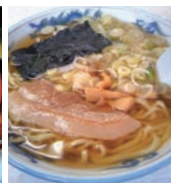
▲美好食堂(只見町) ラーメン