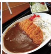
▲本屋食堂(昭和村) カツカレー