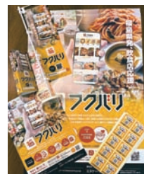
▲販促物の無料配布(初回契約時)

現在、郡山市を中心に約20店舗の飲食店がフクバリ加盟店となっています。テイクアウトも宅配も対応可能なので、新たにサイトを準備する必要はありません。また、事前予約・決済のため無断キャンセルやフードロスを防止することができます。フクバリサイト内でのクーポン発行など、さまざまな場面で運用をサポートできます。