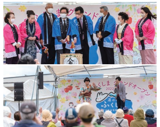
▲4月27日グランドオープンの様子

道の駅ふくしまは東北道からもアクセスしやすく、観光果樹園が並ぶフルーツライン沿いの東北中央道大笹生IC近くに立地し、飯坂温泉や土湯温泉・高湯温泉などの温泉地も近くにあります。回遊性を高めることで道の駅ふくしまを中心とした観光振興や地域活性化が期待されています。回遊性を高める仕掛けのひとつが公式アプリ。イベント情報やお得なクーポン、周辺施設情報などの配信はもちろん、アプリ会員になると、道の駅を利用するたびに買い物に使えるポイントが貯まるほか、周辺の飲食店や観光スポットのクーポンも入手できます。また、スタンプラリー機能もあるのでスタンプを集めながら福島市を見て、食べて、楽しんでもらいたいです。