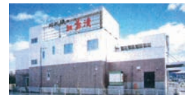
▲平成8年 新社屋完成

伊達市梁川町希望ヶ丘10 TEL.024-577-0658 FAX.024-577-2546 http://www.abukumakouyou.jp