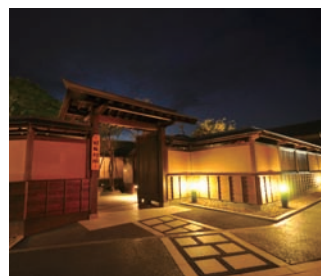
▲温泉街に浮かびあがるたたずまい

福島市の北西部、摺上川上流に奥州三名湯に数えられる古の湯 飯坂温泉があり、そのほぼ中央に江戸期の佇まいを今なお残す「まちの駅 旧堀切邸」があります。こちらは、江戸時代の豪農、豪商の旧家を補修、復原、一部新築により整備し、平成22年5月に開館、昨年10周年を迎えました。毎年7下旬～8月上旬におこなわれる風鈴の絵付け体験会は、家族連れやカップルに人気があり、また自宅でこけしに絵付けし手紙を添えて大切な人へ送る思いのこけしキットもお土産として好評です。この4月には、市内の珈琲専門店とコラボしたオリジナルブレンドコーヒーをはじめましたので、ぜひご賞味ください。