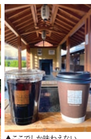
▲ここでしか味わえないオリジナルブレンド