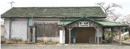
◀解体前の旧夜ノ森駅舎

3月14日より運転が再開される夜ノ森駅は、「花と緑あふれる町」双葉郡富岡町にある駅です。運転再開に合わせて自由通路の建設も進められており、町の新たな玄関口として利用者を迎えます。