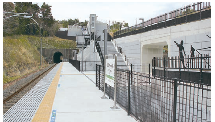
▲Jヴィレッジ駅

日本最大級の規模であるサッカーのナショナルトレーニングセンター Jヴィレッジは、2020年東京五輪の聖火リレーの出発地点としても注目を集めており、オリンピック・パラリンピックへの関心が高まる中、更なる利用者拡大が見込まれます。