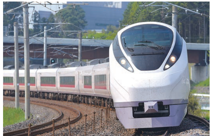
▲E657系 特急ひたち

夜の森地区は、町の木である桜が美しく咲き誇る名所として知られています。4月には桜まつりの開催も予定されており、「桜のトンネル」とも呼ばれる桜並木は見る者を魅了します。