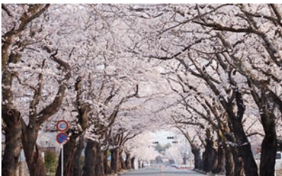
▲2018年4月 桜並木の様子

夜の森地区は、町の木である桜が美しく咲き誇る名所として知られています。4月には桜まつりの開催も予定されており、「桜のトンネル」とも呼ばれる桜並木は見る者を魅了します。