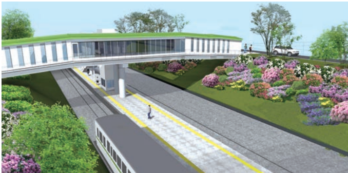
▲夜ノ森駅 完成予定図