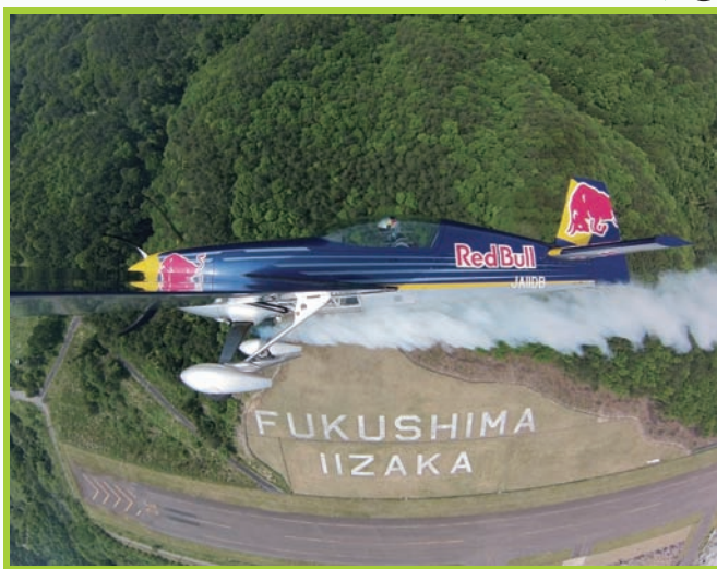
PATHFINDER

カイスポーツ教室を行ってきましたが、今秋に専用施設をふくしまスカイパークに設置し、定期開催していきます。さらにそれらの人材が就業し始める2025年に向けて航空産業の創出・誘致を働きかけます。