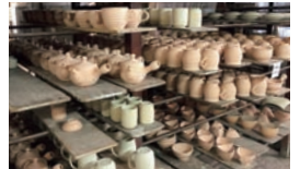
▲作品になる前の大事な時間